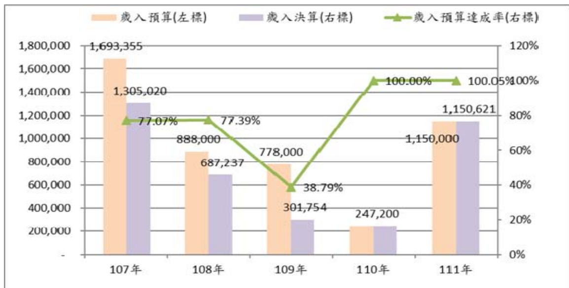
圖 1 107~111 年高雄市政府捷運工程局歲入預決算概況 單位:千元

資料來源：高雄市政府捷運工程局。 備註：歲入預算達成率=決算數÷預算數×100。